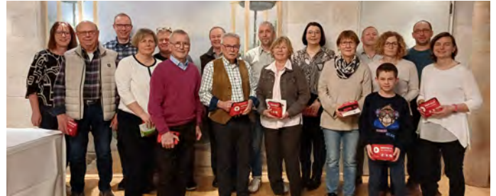
Der Großteil der Wanderführer