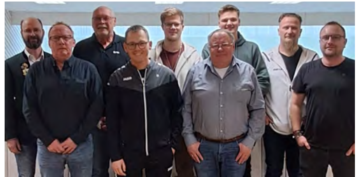
Die neue Vorstandschaft