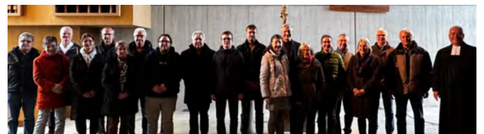
Der alte und neue KGR