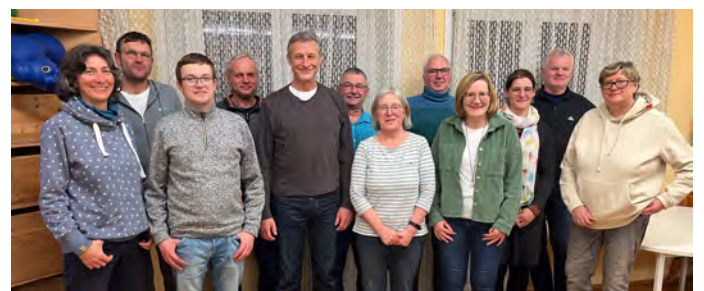
Der neue KGR bei seiner ersten Sitzung